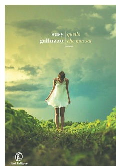
• "Quello che non sai"

Un esordio che colpisce. Con voce intensa ecco la rinuncia alla "sua" vita da parte di Ella, che cresce la figlia sacrificando il lavoro di medico e il rapporto con il marito. Tutto crolla quando realizza che non ha più voglia di essere né madre né moglie e dunque di accettare la vita che aveva scelto per amore della famiglia, perdendo in questo modo la sua identità. Un romanzo sulla maternità e sulla