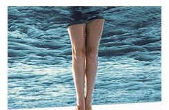
RICHARD RUSSO LE CONSEGUENZE ROMANZO