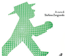
• La felicità dei mobilifici