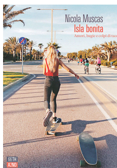
• Calcio e non solo in "Isola bonita"

Un romanzo d'esordio che lascia il segno. Un giallo ambientato nel