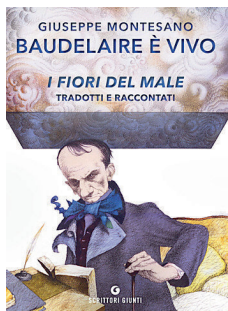
• Baudelaire è vivo

I nostri suggerimenti. Jean-Patrick Manchette, teorico del poliziesco quale forma moderna della letteratura morale, torna alla ribalta grazie alla sua scrittura ironica e ai disegni di Jacques Tardi