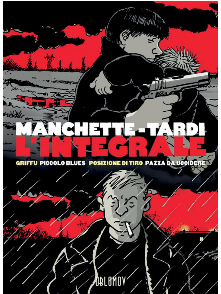
• L'integrale di Manchette con i disegni di Tardi

mondo del calcio. Protagonista Santiago Ramiro Rodriguez, El Gordo. Calciatore uruguayano sul viale del tramonto, vive immerso nei suoi eccessi: alcol, donne, gioco d'azzardo. Era una stella, ora campa alle spalle della suocera e della giovane moglie. Il destino gli regala un ingaggio a sorpresa, lì dove a vent'anni aveva esordito tra i professionisti. A Cagliari, in Sardegna, la sua isola bonita. Avventure e disavventure lo attendono. Colpi di tacco, vendette, rimpianti, rum e nostalgia. Gool.